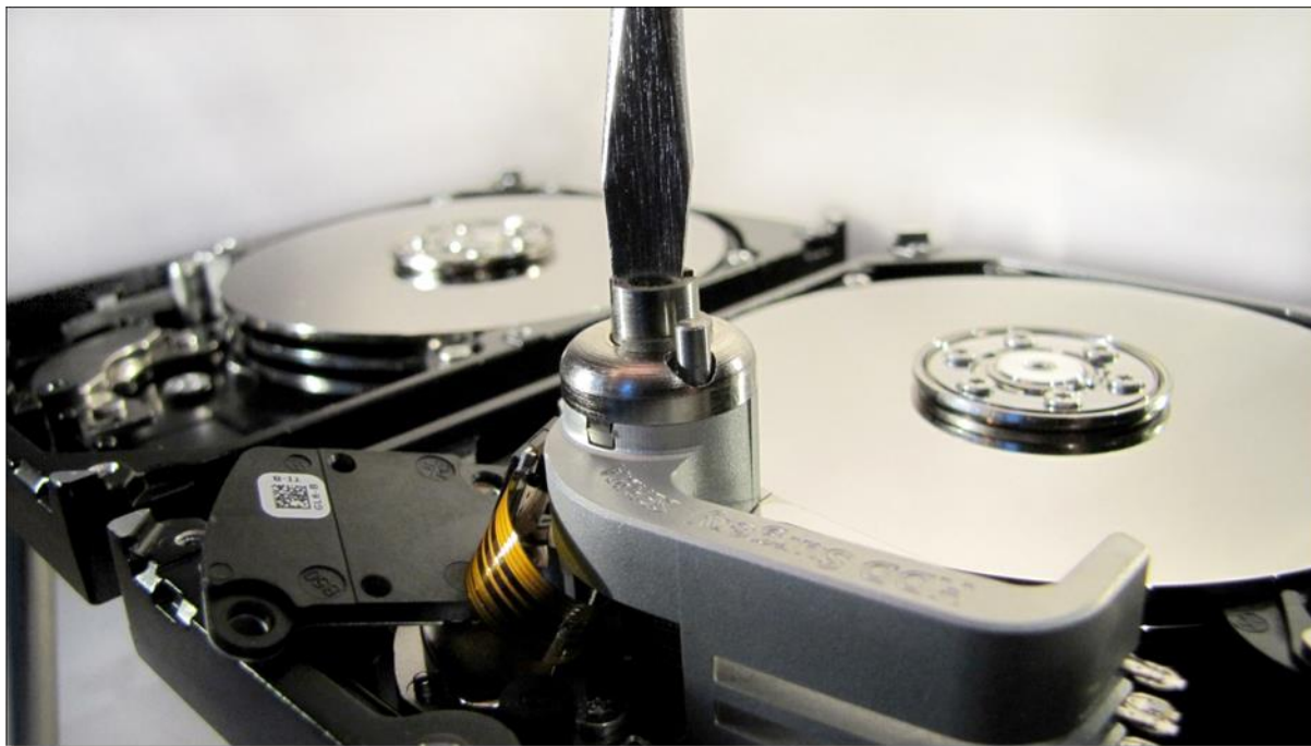
図 6. (ヘッドの取り外し)

このステップを1ヘッドのハードドライブで行っている時は、ヘッドがツールから動かず、滑り落ちることのないように確認して作業を行って下さい。