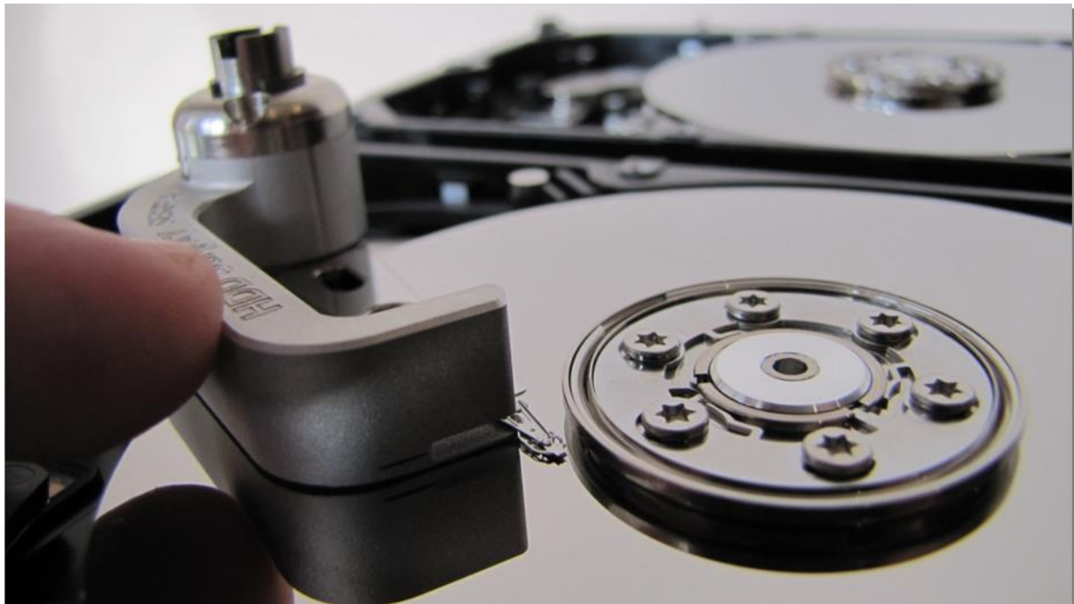
図 3. (ヘッドリフト)

ツールの先端を水平方向へ動かして、プラッターの上を移動させます。ツールの構造により弱い力でもヘッドがリフトされます。強い力が必要な場合は、ツールの位置が正しくない可能性や、そのまま作業することによって HDA に損傷が発生する可能性があります。できる限り奥までツールを移動させます。