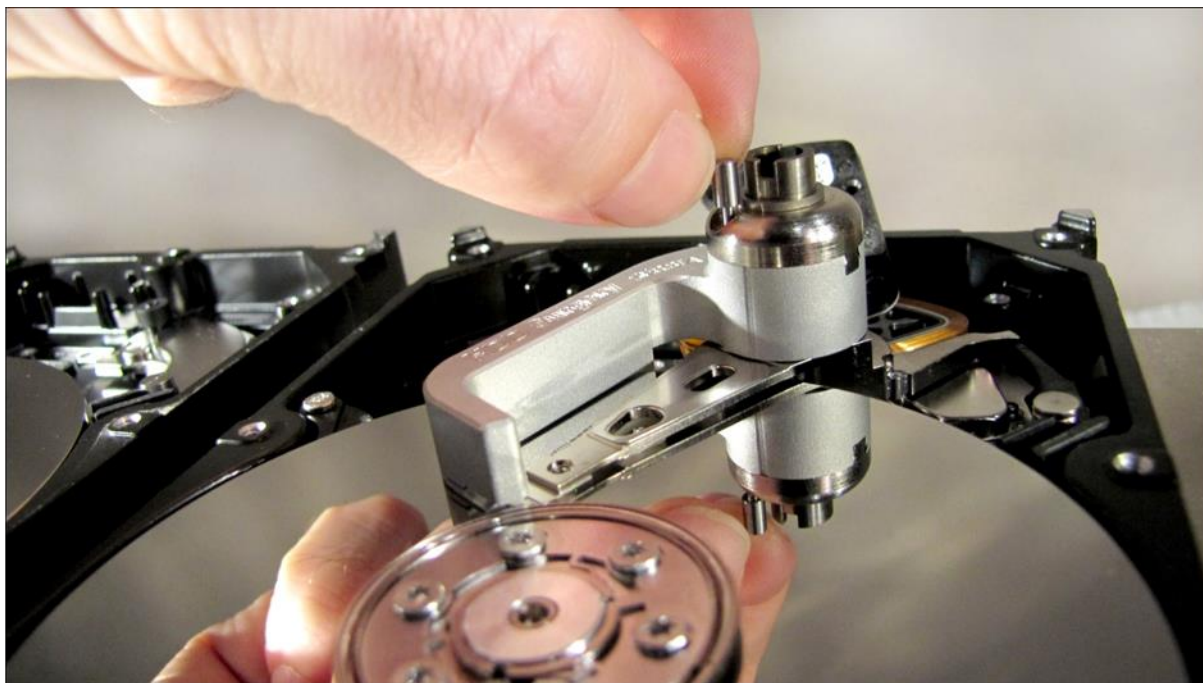
図 8. (固定ピンを取り外す)