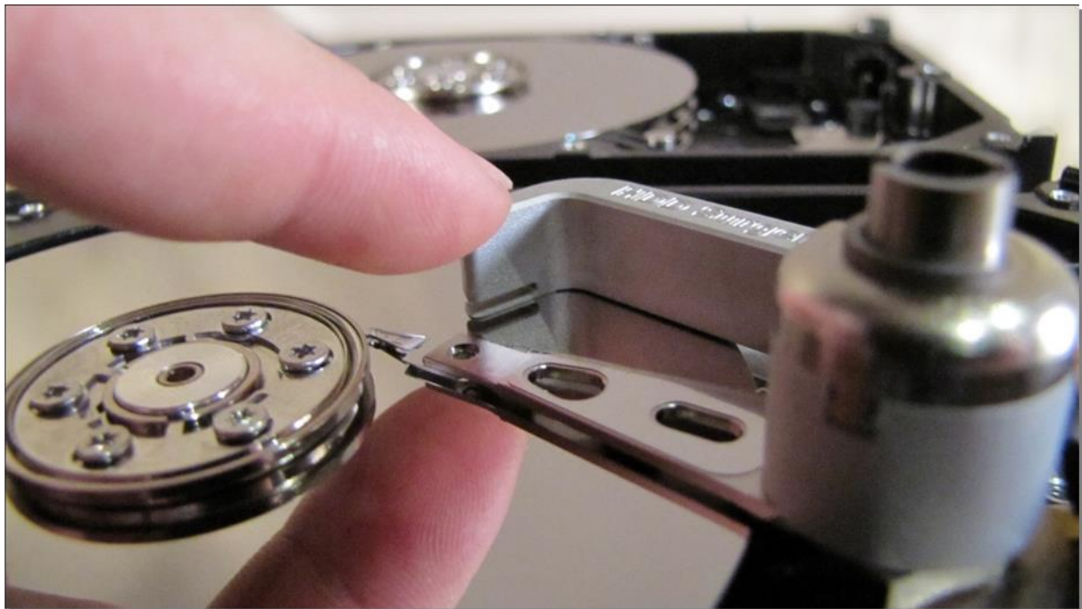
図 9. (ツールをプラッターの外に移動させる)

ツールを移動させるとき、ヘッドの移動を防止するために残りの手でアーム端部(磁気コイル側)を固定して下さい。