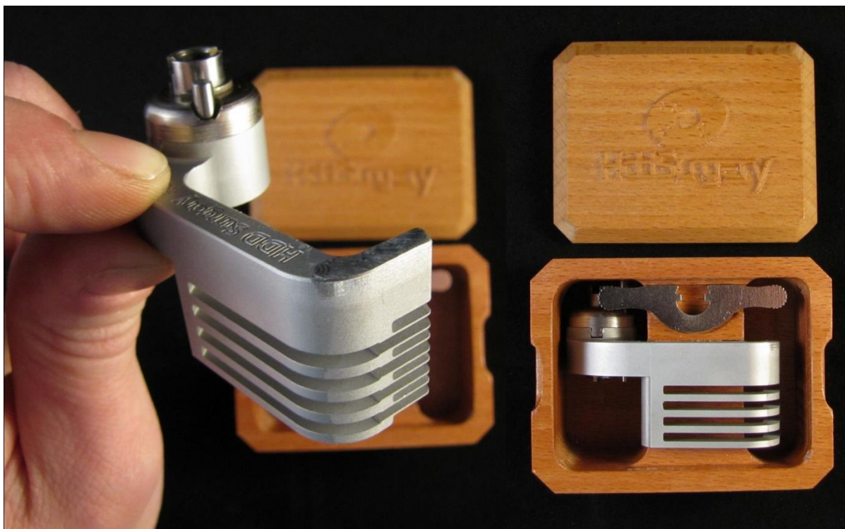
図 1. (ツールの取り扱い)

ハードドライブのプラッターは汚れに弱いので、ツールを使用する前によく掃除して下さい。綿とアルコールで掃除をします。リフトパーツを掃除する時は、特に注意して下さい。