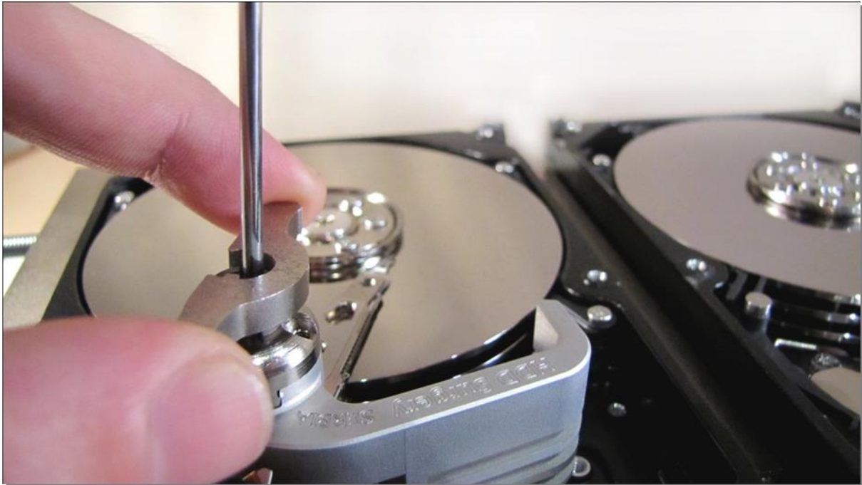
図 10. (補助ツールを使用してツールを取り外す)