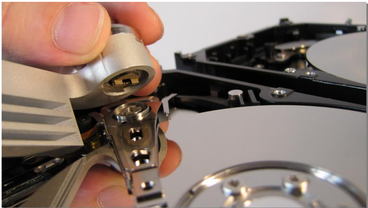
図 2. (ツールの設置)

ディスクヘッドの中央の穴に慎重にツールを合わせ、ツールの底部とアクチュエーターアームの土台が合うように注意して設置します。ネジを締めてツールを固定します。