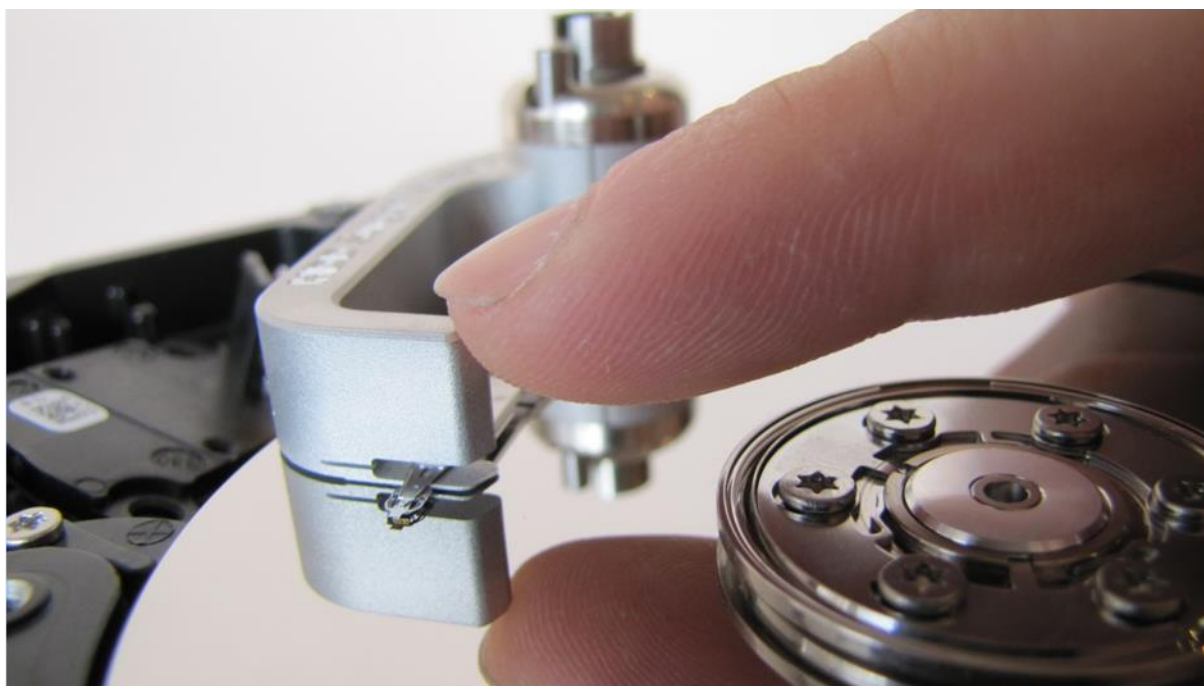
図 5. (プラッタの外側にヘッドを固定したツールを移動させる)

HDSS Sea 7200.9 p1 ツールを 1 ヘッドのハードディスクに使用するとき、ヘッドアーム後部を押してヘッドをプラッター外に動かして下さい。これは、ヘッドがツールにピンで固定されておらずツールから外れて落ちる可能性もあることから、非常に重要な作業です。