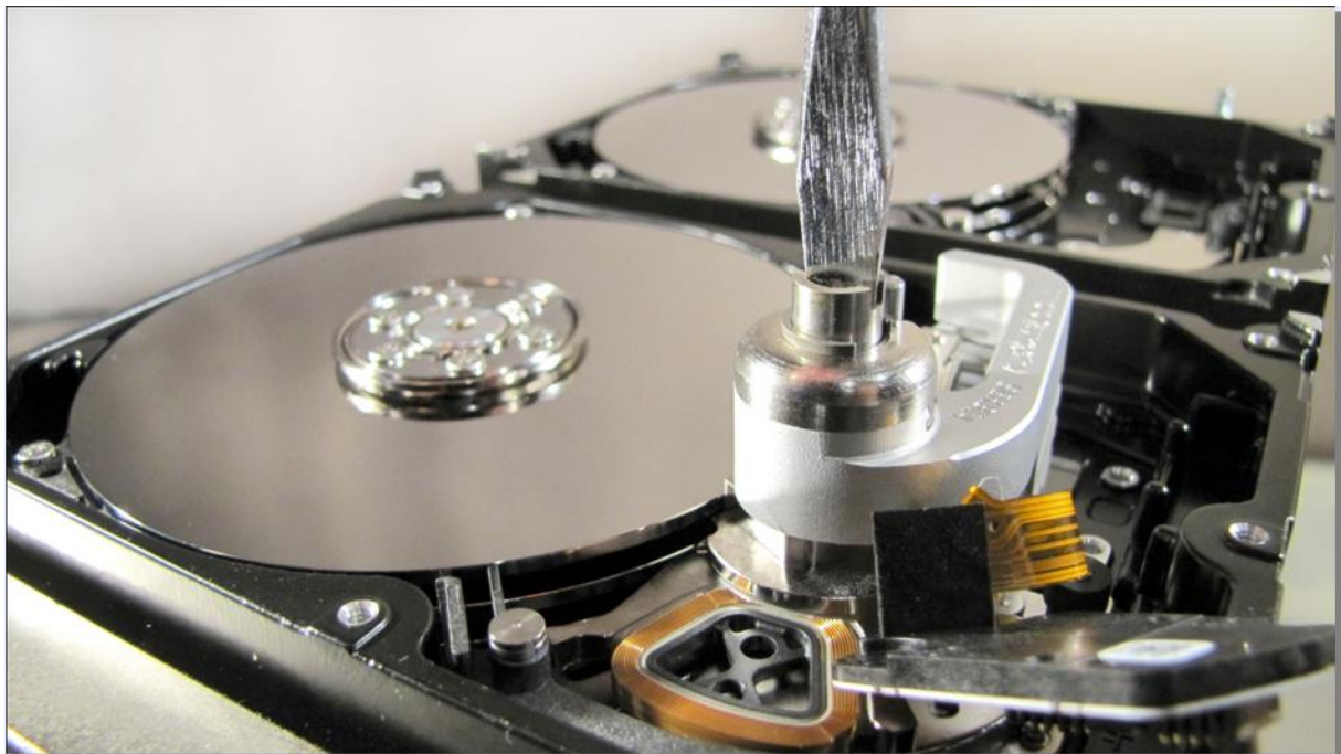
図 7. (障害ドライブへのツールの設置)

ここでも、1ヘッドのハードドライブについては、ヘッドがツールから外れることのないよう注意して作業して下さい。